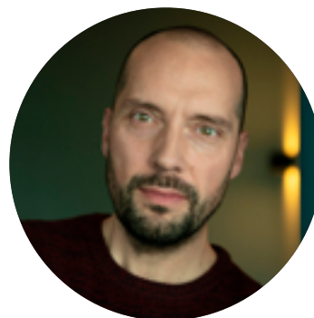
BLOG ZONA 7