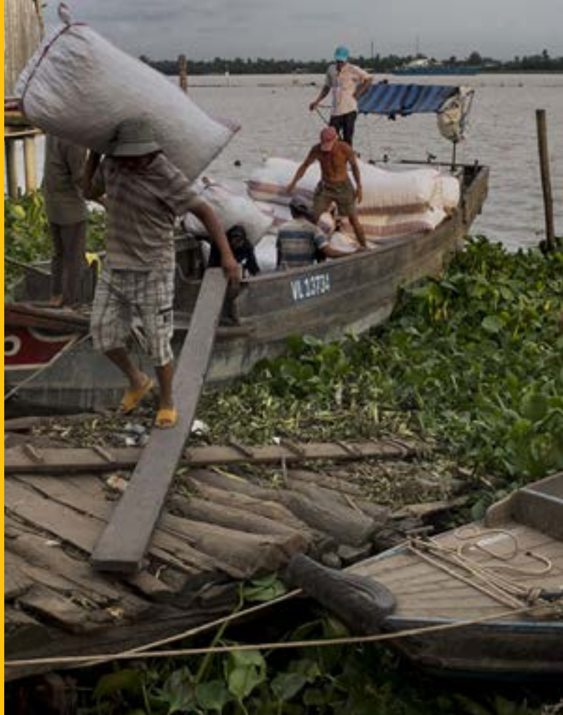
Fotografía de Antonio López Díaz